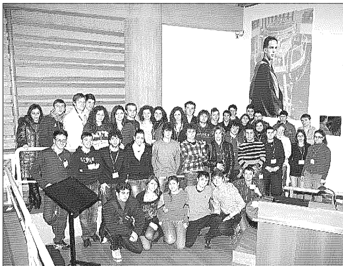
Studenti del Chelli Nei laboratori di Frascati

"Nei quattro giorni passati ai Laboratori Nazionali di Frascati abbiamo potuto assistere a lezioni svolte dai più illustri studiosi italiani