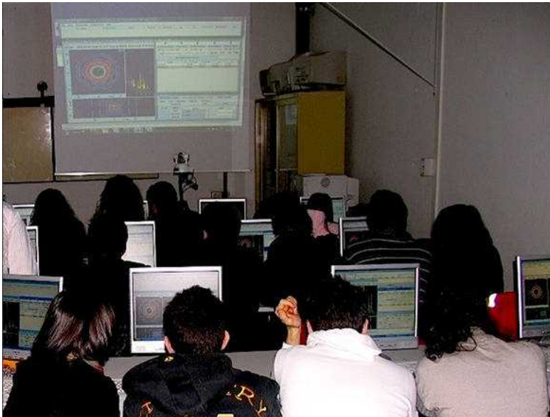
Ragazzi impegnati in un laboratorio Masterclass

Indietro | Stampa | Invia | Scrivi alla redazione | Suggestisci ()